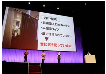
■5つ星サロン パネルディスカッション