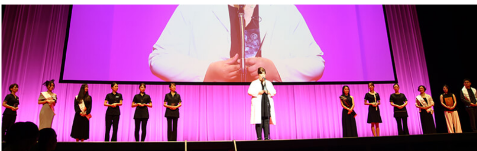
■ボディ結果出し部門 受賞者表彰