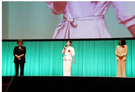
■フェイシャル技術部門 審査員総評