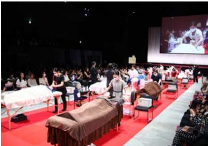
■フェイシャル技術部門 競技