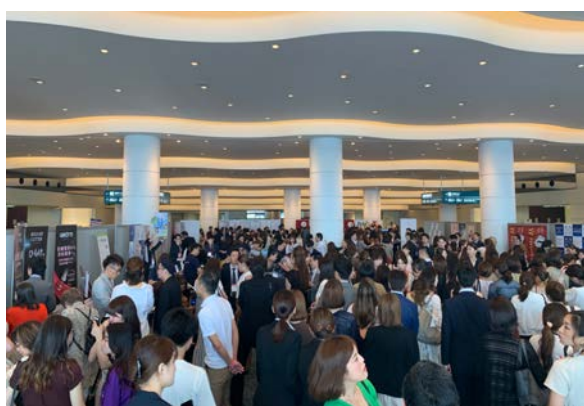
■7/2 にぎわうロビーとサポーター企業ブース