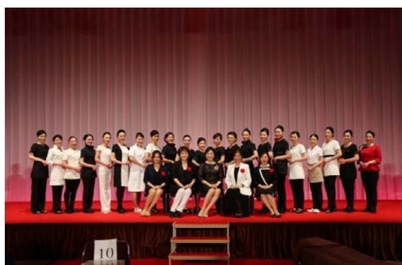
■7/1 21名のセミファイナリストと審査員