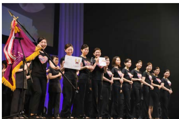
■7/2 モデルサロン部門グランプリ「ANDEALなかもず店」