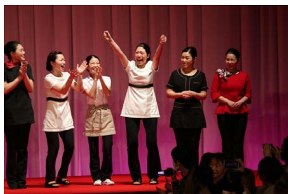
■7/1フェイシャル技術部門ファイナル出場者発表