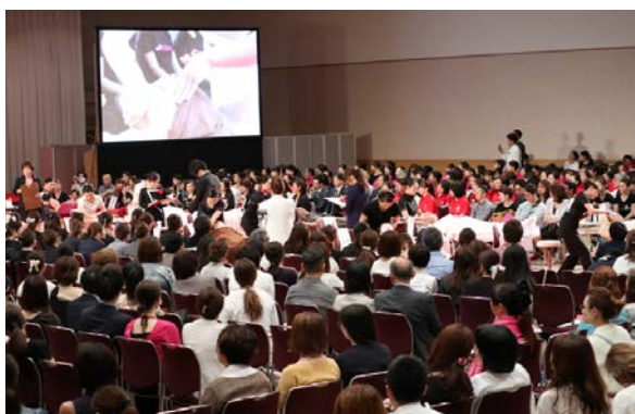
■7/1 フェイシャル技術部門セミファイナル(競技中)